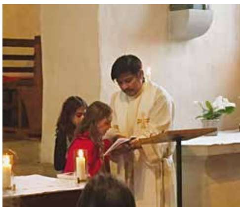
Momenti della celebrazione della S. Messa.