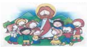
Lasciate che i bambini vengano a me (Mt 19:14)

Incontri di preghiera per i bambini e con i bambini