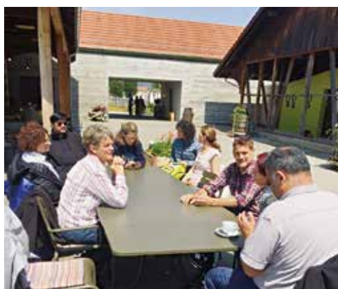
Momento di ristoro tra genitori e catechisti.