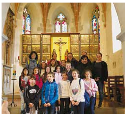
I ragazzi davanti all'altare.