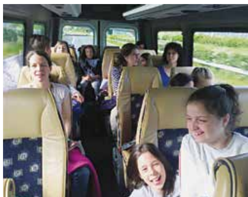
In viaggio per Ettiswill.