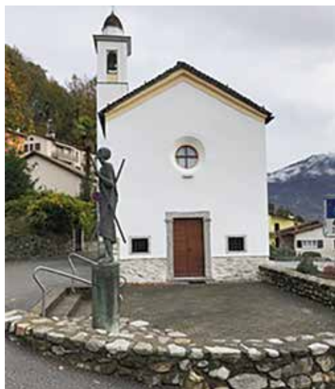
... e prima dell'intervento