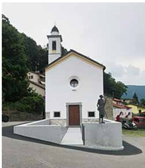
Come appare oggi il sagrato