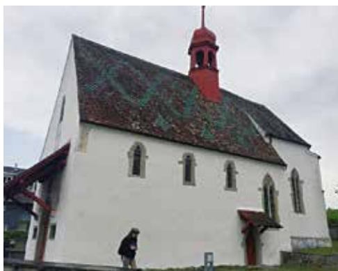
Santuario costruito nel luogo del ritrovamento dell'Eucrestia.