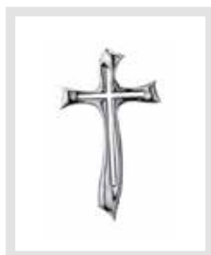
Elvezia Galli 1951 – 3 ottobre 2019 Tesserete